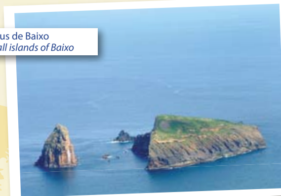
Ilhéus de Baixo Small islands of Baixo

1 Este trilha começa junto ao caminho de acesso ao Parque Eólico da Serra Branca, termina na Praia e tem a duração total de 2h30m.