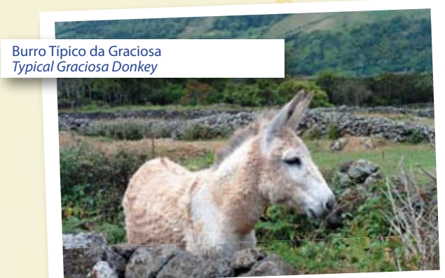
Burro Típico da Graciosa Typical Graciosa Donkey

At the end of the trail, the sea and the small island of Praia can be seen in all their glory.