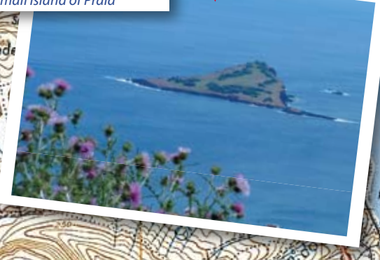
Ilhéu da Praia Small island of Praia