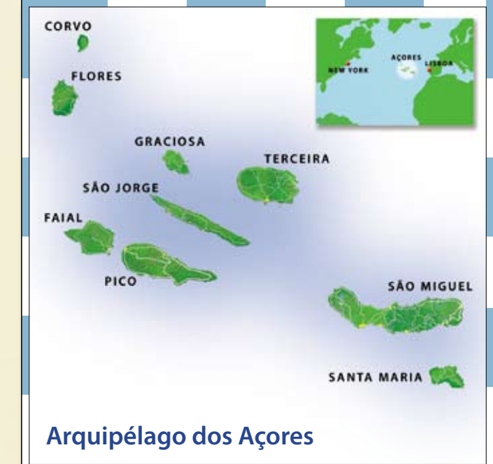
Arquipélago dos Açores

Número nacional de emergência 112 Emergency call number