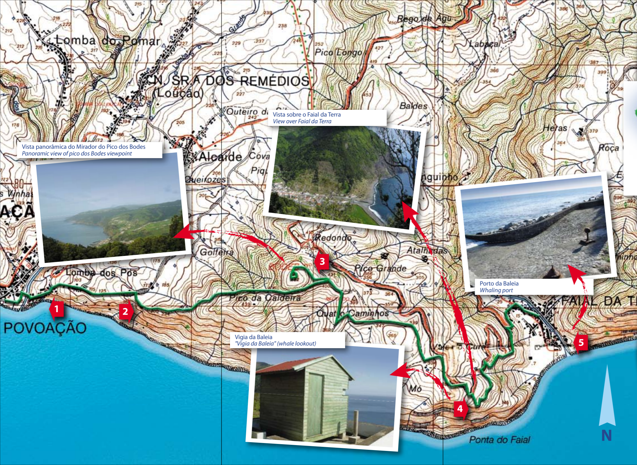
Vista panorâmica do Mirador do Pico dos Bodes Panoramic view of pico dos Bodes viewpoint