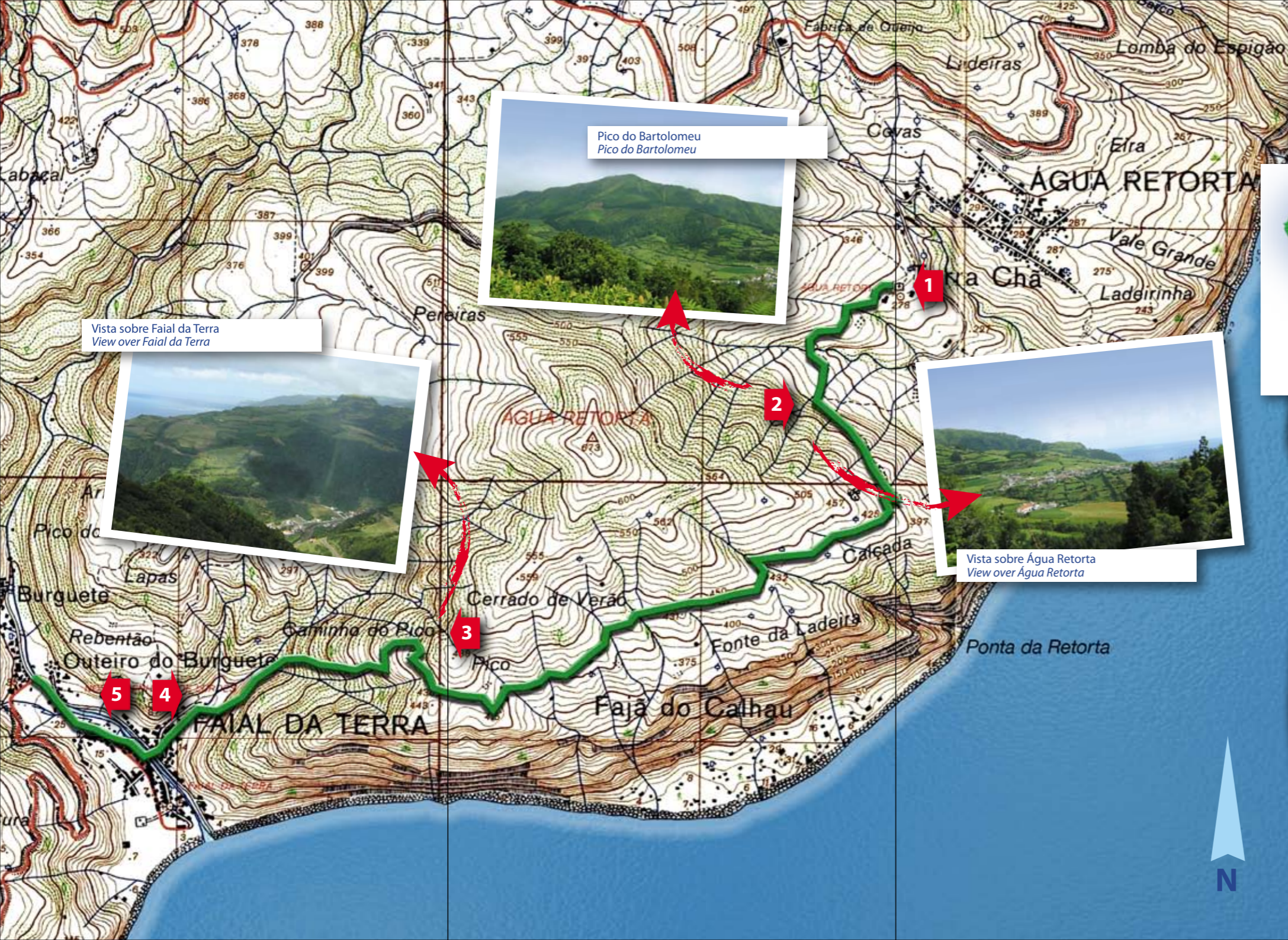
Pico do Bartolomeu Pico do Bartolomeu