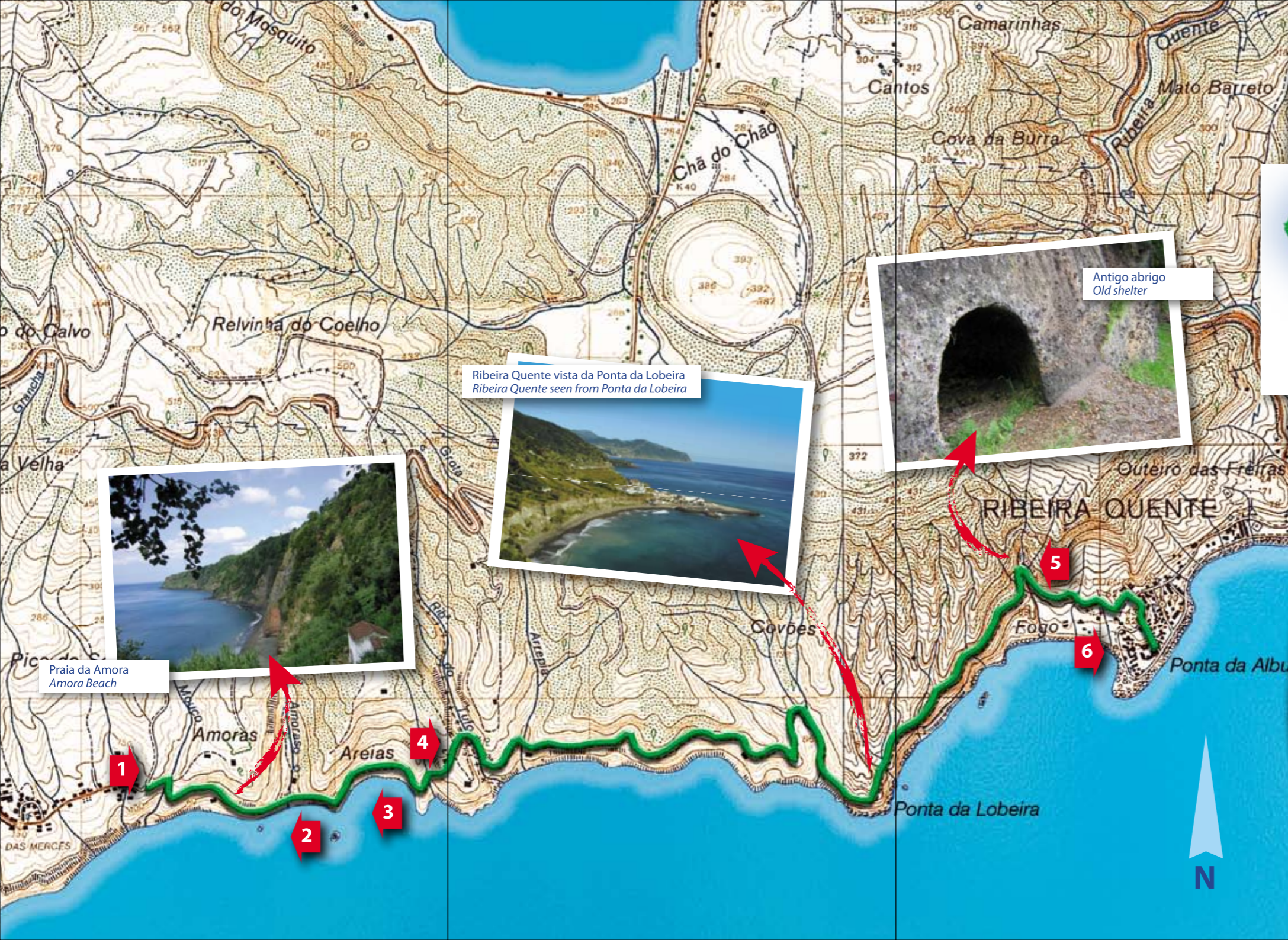
Antigo abrigo Old shelter