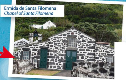
Ermidão de Santa Filomena Chapel of Santa Filomena