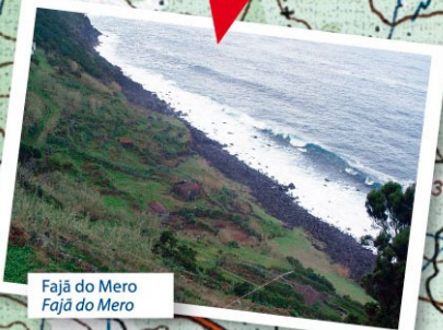
Fajã do Mero Fajã do Mero