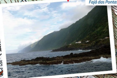
Fajã das Pontas Fajã das Pontas