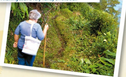
Um bordão é um auxiliar muito útil neste trilho A walking stick is very handy on this trail