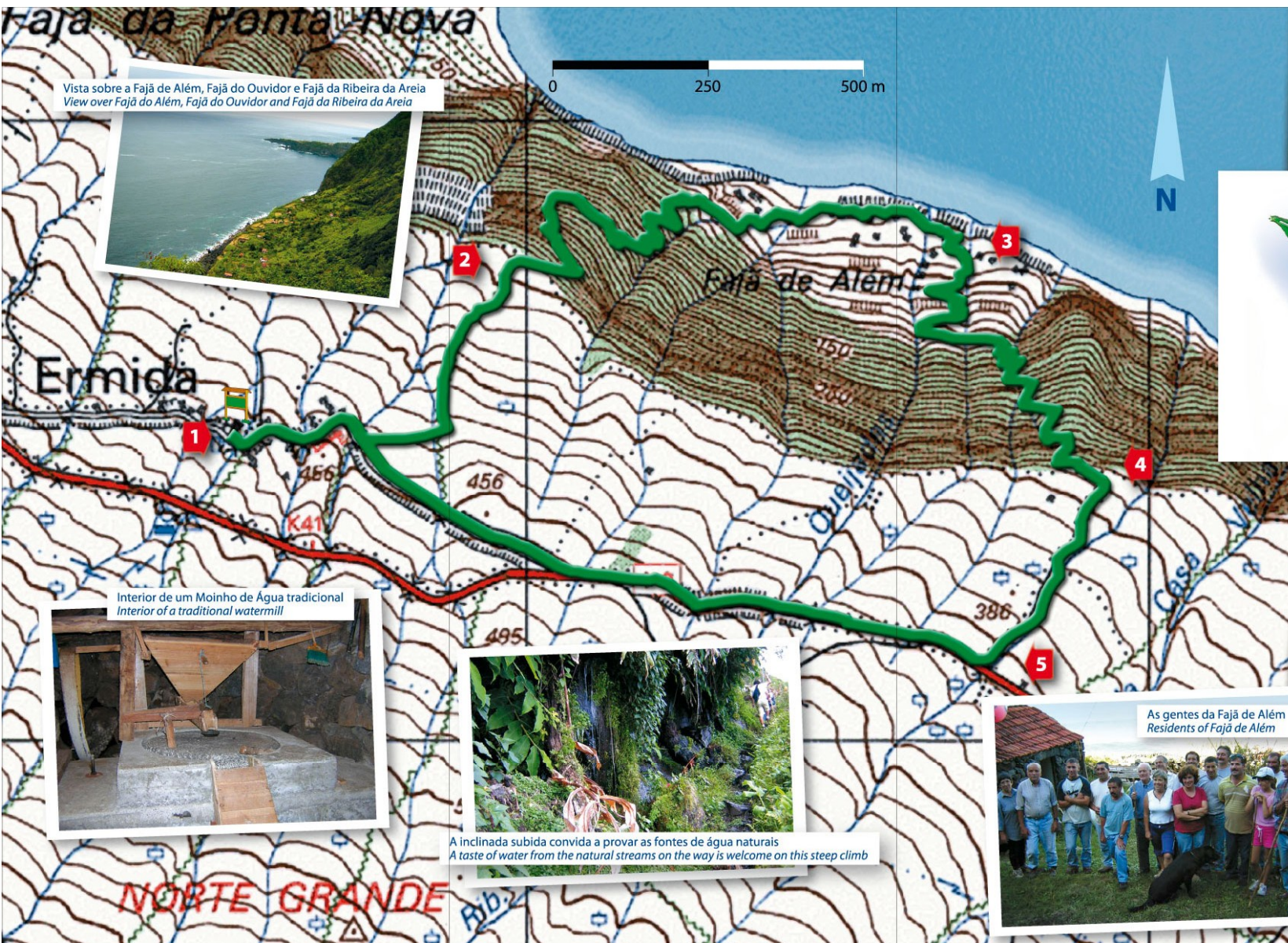
Vista sobre a Fajã de Além, Fajã do Ouvidor e Fajã da Ribeira da Areia View over Fajã de Além, Fajã do Ouvidor and Fajã da Ribeira da Areia