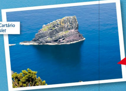
Ilhéu do Cartário Cartário islet