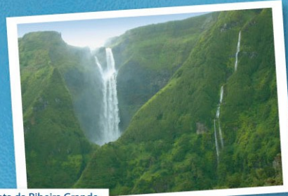
Cascata da Ribeira Grande Ribeira Grande waterfall