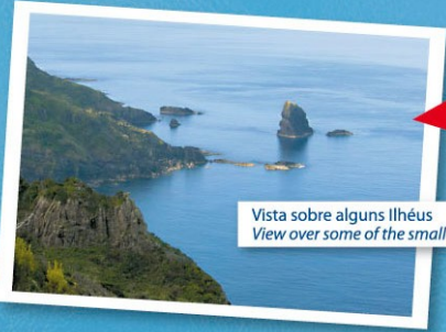
Vista sobre alguns Ilhéus View over some of the small islands