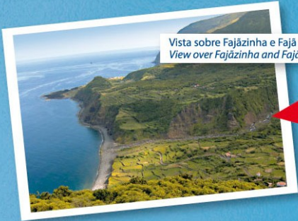
Vista sobre Fajãzinha e Fajã Grande View over Fajãzinha and Fajã Grande